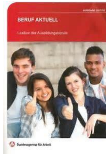
„BERUF AKTUELL“ Lexikon der Ausbildungsberufe