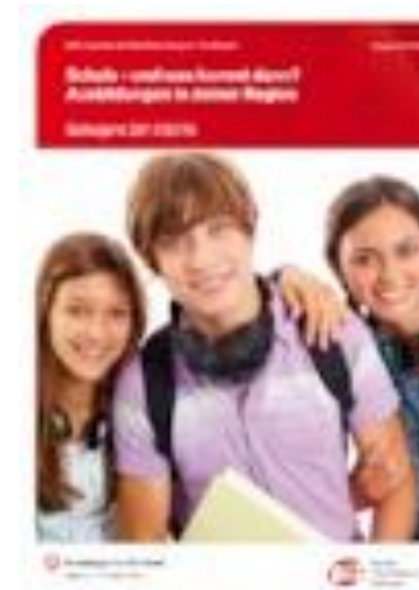
"Schule - und was kommt dann? Ausbildungen in deiner Region"

Link: https://www.arbeitsagentur.de/vor-ort/fuerth/biz